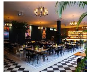
par Christelle Vougo & Franck Anet

La cuisine est américaine, gouteuse et addictive. Situé aux 2 plateaux, le lieu a fait peau neuve et s'est agrandi, laissant la place belle dès l'entrée à une cave à vins, une immense salle aux proportions équilibrées et un magnifique bar qui donne envie de se poser !!! Le service est agréable! L'ambiance aussi bien professionnelle que familiale!