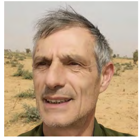
Un développement de nos connaissances en somme. Tout simplement.